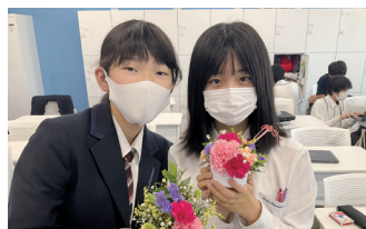
「華道」。このような可愛いものを創作したりと生徒たちも楽しく活動しています。

新年度が始まり、大阪国際中学校の大きな特徴でもある「総合学習」も新しい講座がスタートしました!!「総合学習」とは中2・3生が毎週土曜日2・3時間目を選択制で「マジック」「華道」「書道」「美術」「プログラミング」「カメラ」「園芸」「囲碁」「PBL」「ダンス」といった講座を半年ごとに受講するシステムです。教員だけでなく、業界の最前線で活躍されているプロの方たちから直接教えてもらえるコースもある貴重な機会です!!