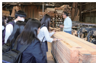
高1生のII類とIBコースは奈良県吉野で吉野杉の製材所を訪問しました。

5月10日(水) 中学・高校ともに校外学習が実施されました。着物体験や坐禅体験、自然の中でのBBQや姫路科学館・姫路城見学など、学年・コースによって行き先が異なるバラエティに富んだ校外学習となりました。高3は今年が最後となる校外学習。六甲山アスレチックパークGREENIAで体を思いっきり動かしていました。学校では受験生として学習に励んでいる生徒たちですが、良いリフレッシュになったのではないのでしょうか。