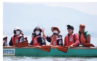
中1生は滋賀県のオーバルオブテックスで、カヌー・ヨシ紙笛づくり・ドラゴンボートを体験!!