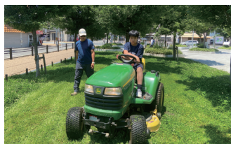
「園芸」の授業。ゴーカートのような乗用草刈機に乗る体験も!!