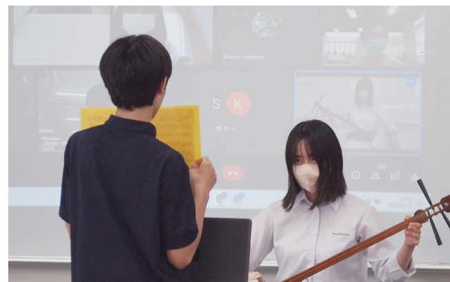
三味線の演奏後、台湾のみんなから盛大な拍手がおきました。